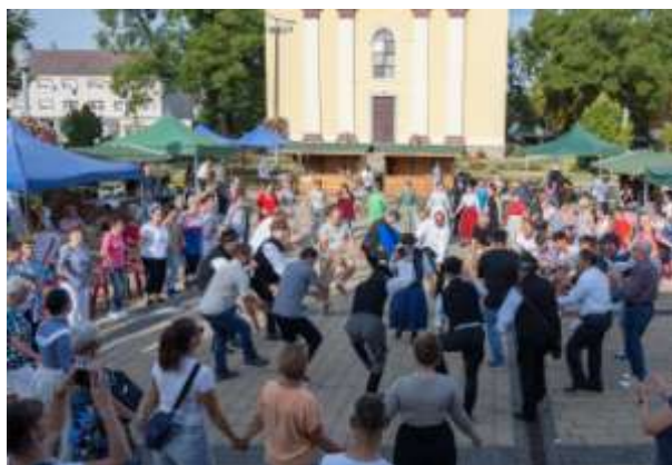
A polgári csapásolás tanítása