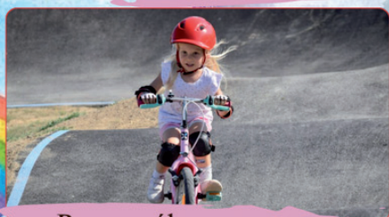
Pumpapálya ügyességi verseny